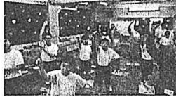
【タイタニックゲーム】