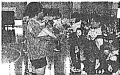
【学級に花のプレゼント】

生徒会本部による学校生活や委員会活動の紹介、各部活動の趣向を凝らした発表を行いました。いよいよ、5月1日から1年生は部活動も本入部になります。充実した学校生活にしていきたいと思います。