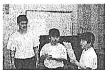
【司会・開会の言葉】