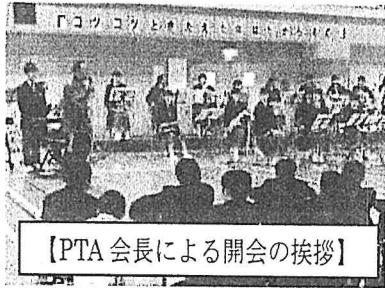
【PTA 会長による開会の挨拶】

午前中は授業公開、午後は学校、保護者、後援会による模擬店、バザー、写真販売、健康教室を開催しました。地域の方の多くの参加をいただき、大いに盛り上がりました。