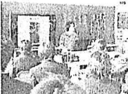
【職業ガイダンス講師】