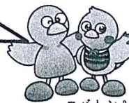
コバトン&さいたまっち

保護者の会の皆さんとお話してみませんか 子供とどのように関わったら良いのだろう。 同じ悩みをもった人と話しができないかな。 こんな交流の場があります。