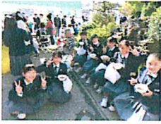
【水光園で楽しくお食事】