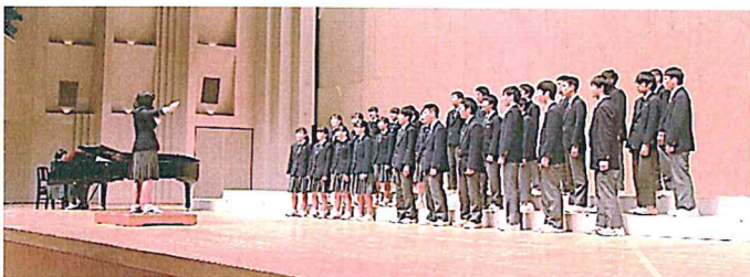
【最優秀賞3年1組の合唱・リリア】