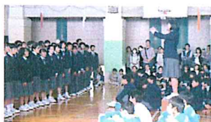
【オープニングセレモニー岸川合唱隊】

午前中は授業公開、午後は模擬店、バザー、写真販売、健康教室を開催しました。保護者、後援会の皆様には事前準備から当日の運営、片付けまでご協力いただきありがとうございました。生徒にとっても潤いのある楽しい一日となりました。