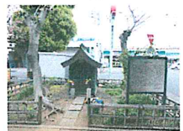
愛宕さま（前川第一公園）