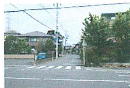
スーパー近くの交差点より岸川中方面を望む。わずかに登り坂になっていることがわかる。

【お詫び】4月号の岸川中学校ホームページのURLが間違えていました。お詫び申し上げます。