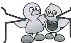
コバトン&さいたまっち

子供とどのように関わったら良いのだろう。 同じ悩みをもった人と話ができないかな。 こんな交流の場がありますよ。