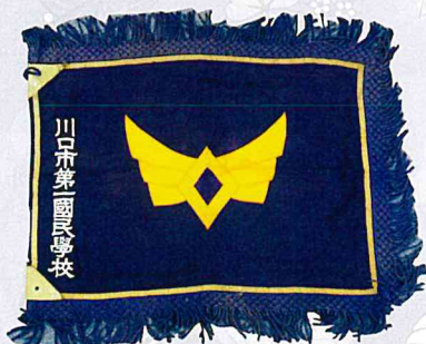
① 第1国民学校（現本町小学校）の校旗