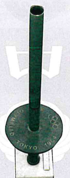
② 十二月田小学校に寄贈された東京オリンピックの聖火トーチ（レプリカ）