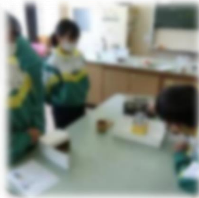
理科:水の電気分解