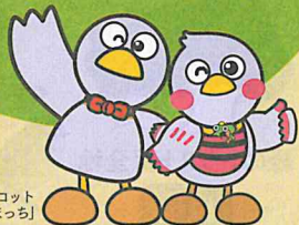
埼玉県マスコット 「コバトン&さいたまっちゃん」