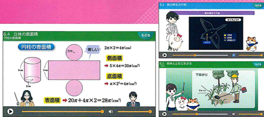
▲イラストや図などを活用したムービー。再生・早送り・巻き戻し・一時停止も可能。