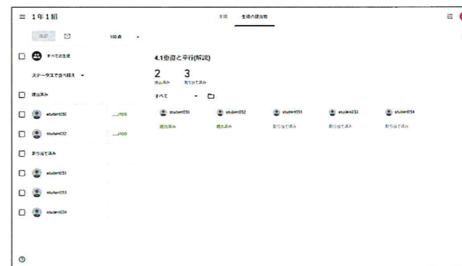
▲Google Classroom で、ニューコース学習システムの実施状況を把握

※ Google、G Suite for Education、Google Classroom は Google LLC の商標です。