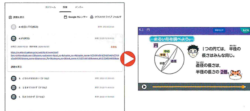
▲Google Classroom から、そのままニューコース学習システムを利用