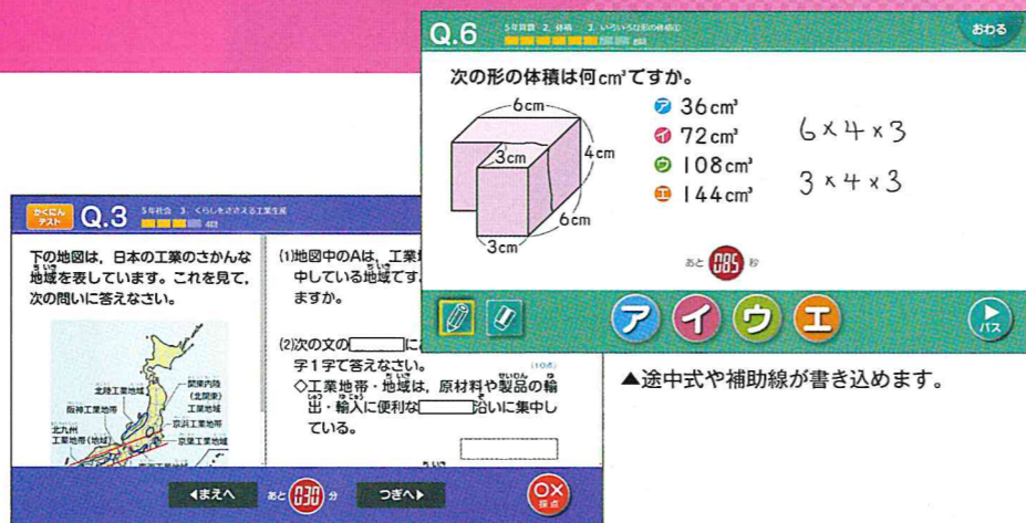
▲より深く学べるトライアル学習。