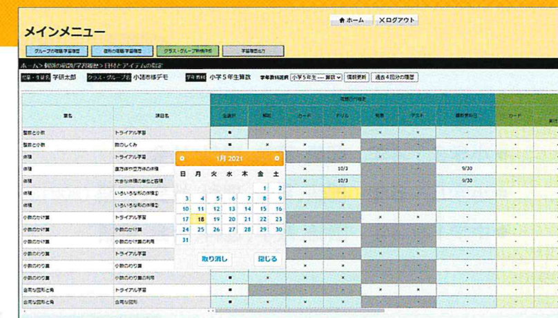
▶学習状況の把握と宿題配信が同一画面上で行えます。