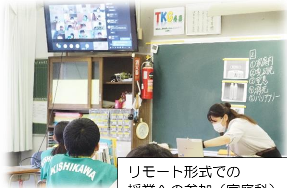
リモート形式での 授業への参加(家庭科)

また、今日で分散登校7日目になります。分散登校にあたり、48期のみなさんの順応の速さには驚かされました。午前午後の入れ替わりにも、しっかり対応していました。引き続き、協力し合って学校生活を送りましょう。不安なことや分からないことについては、先生たちにいつでも相談してくださいね。