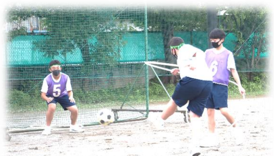
フラフープで距離を保った サッカーの授業(保健体育)