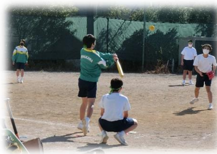
体育：ソフトボール