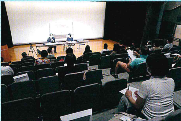
第23回セミナーの様子 (2021年9月25日 川口総合文化センター・リリア)