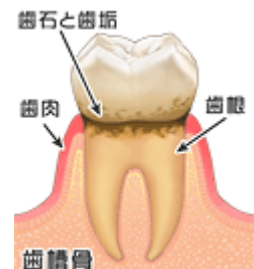
歯肉が赤く腫れた歯肉炎

歯みがきをさぼると、こうなっちゃうよ！ コロナが終わってマスクをはずした時、 きれいな歯や歯肉で笑えるように、 今から準備しておきましょう。