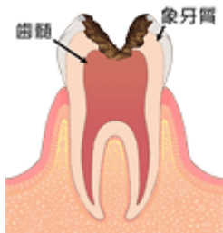
神経まで進んだむし歯