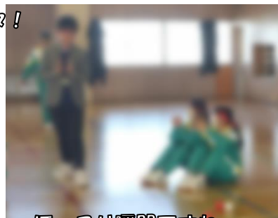
ほっこり瞬間ですね