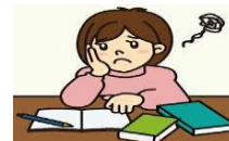
からだや健康のことを 調べられます