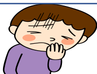
具合が悪いとき に休養します